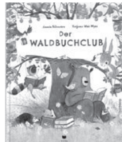
Annie Silvestro: "Der Waldbuchclub"

Herzliche Einladung der Gemeindebücherei zur Vorlesestunde: an der Station Nr. 19 im Rosengarten auf dem Diakoniegelände wird am Familienfest 's Kernle wird Herr Paulowitsch jeweils um 14 und um 15:00 Uhr aus dem Bilderbuch "Der Waldbuchclub" von Annie Silvestro vorlesen.